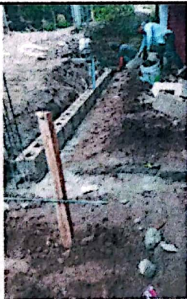
Foto 3: Fundición de solera y colocación de primera hilada de block del mejoramiento tipo pórtico