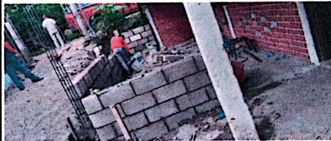
Foto 4: Avance con cuatro hiladas de block del mejoramiento tipo pórtico.

Observación: Si es necesario se pueden agregar hojas adicionales y actualizar el número de hojas.